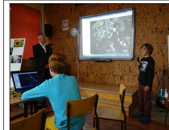
Abb. 6: Die Schüler aus Bernau sind bei ihren Präsentationen erstaunlich „cool“