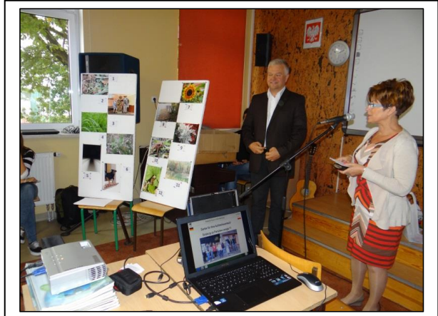
Abb. 10: Die Direktorin der Schule Pszczew ist von den Auftritten der Schüler begeistert