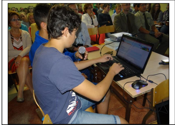
Abb. 8: Schüler aus Pszczew stellen ihre GPS-Tour mit Laptop und Beamer vor