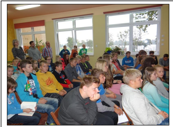
Abb. 9: Das Auditorium besteht aus 80 Schülern und Gästen