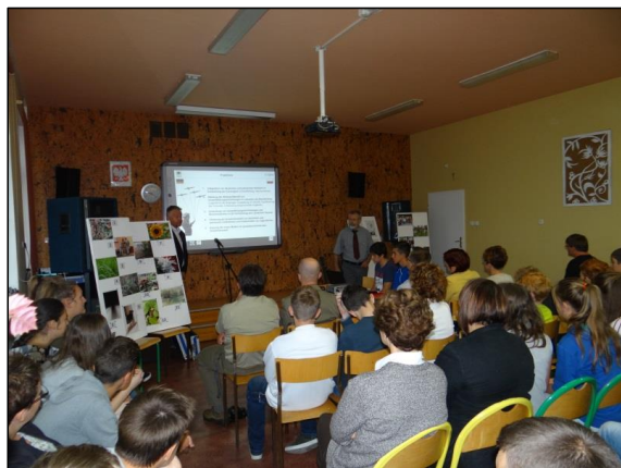
Abb. 3: Aufmerksam werden die Präsentationen der Schüler verfolgt