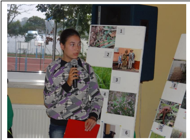
Abb. 7: Eine Schülerin aus Pszczew bei ihrer Präsentation