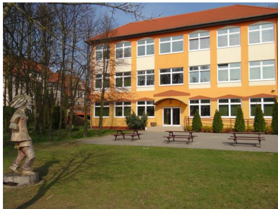
Abb. 1: Das Gymnasium Pszczew als Tagungsort