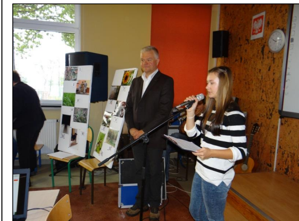
Abb. 4: Eine Schülerin aus Pszczew moderiert den Workshop