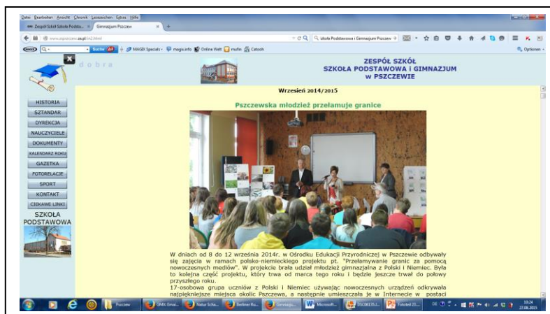
Abb. 11: Artikel zum Workshop auf der Homepage der Schule Pszczew www.zpszczew.za.pl/in2.html