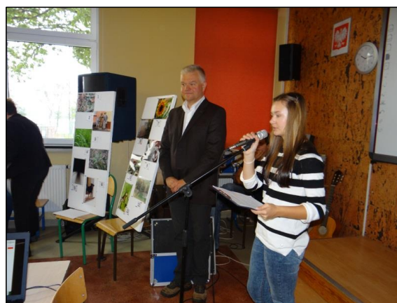
zdjęcie. 4 Uczennica z Pszczewa prowadzi warsztat.