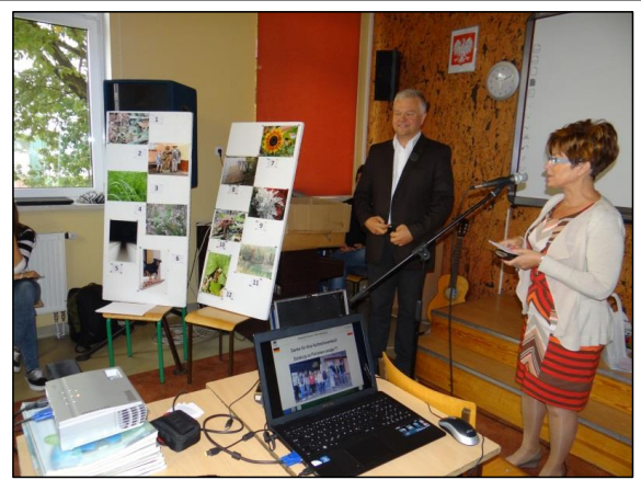
zdjęcie 10: Dyrektor Zespołu Szkół w Pszczewie wyraża zadowolenie z występów swoich uczniów.