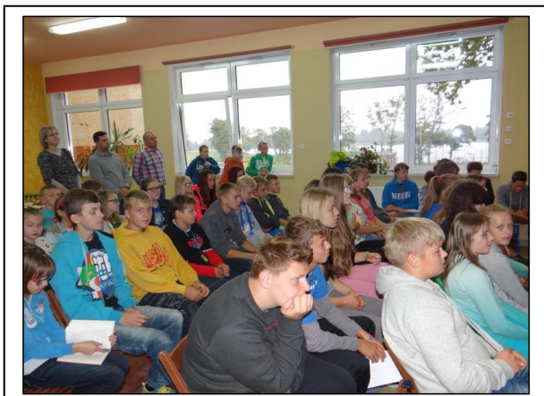
zdjęcie 9: Auditorium 80 uczniów, nauczyciele i goście