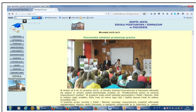
Zdjęcie 11: Artykuł z warsztatu na stronie internetowej szkoły w Pszczewie www.zspszczew.za.pl/in2.html