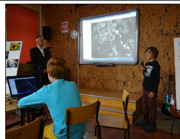
Zdjęcie 6: Uczniowie ze szkoły w Bernau na wyjątkowym luzie.