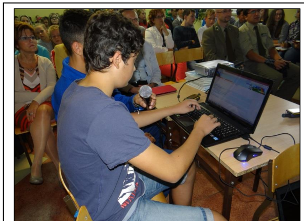
zdjęcie 8: Uczeń z Pszczewa przedstawia trasy GPS na laptopie podłączonym do rzutnika