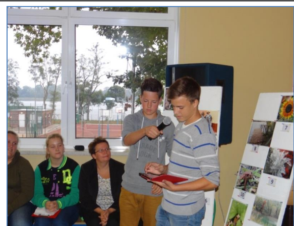
zdjęcia. 5: Prezentacja trasy GPS na tablecie