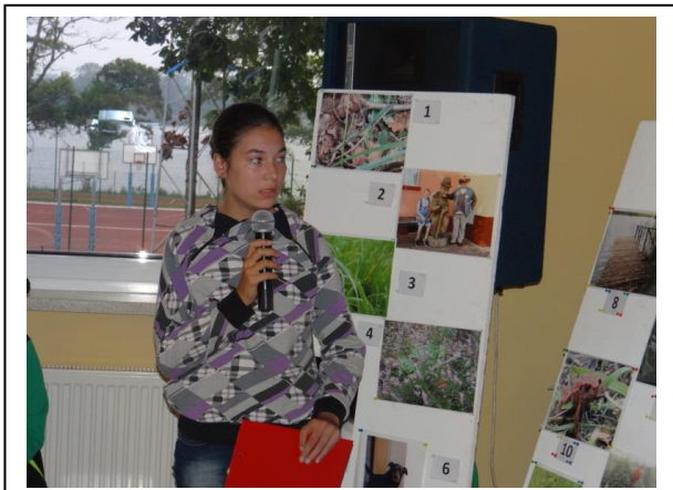
zdjęcie 7: Jedna z uczennic szkoły w Pszczewie w czasie prezentacji