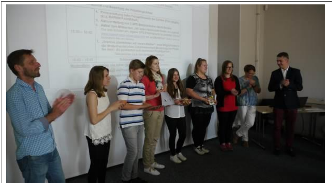
zdjęcie 8: Jury i szczęśliwi laureaci z Wittenbergii i Pszczewa (5. i 6. od lewej)