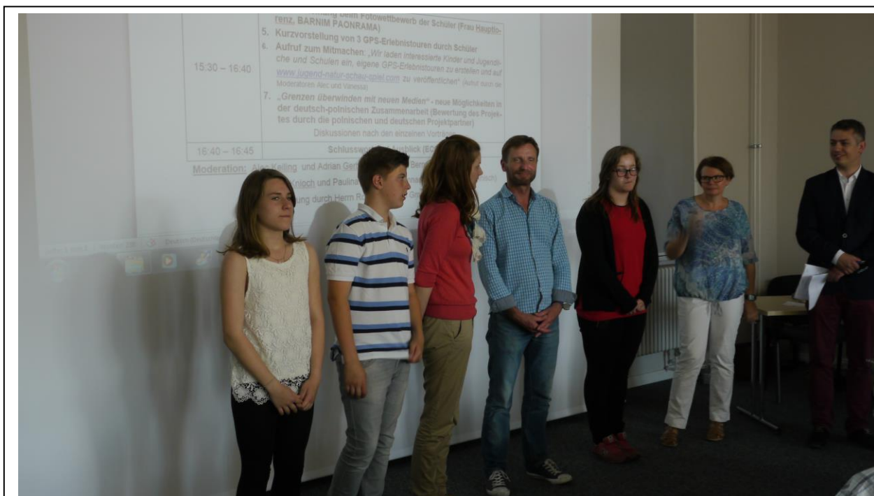
zdjęcie 8: Wymagająca komisja polsko-niemiecka ocenia zdjęcia. Składa się ona z trójki uczniów i trzech osób dorosłych .