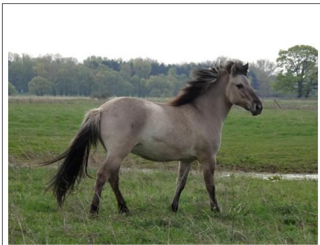
zdjęcie 9 - 10: Nagrodzone zdjęcia z Rezerwatu Przyrody „Biosphärenreservat Flusslandschaft Elbe Brandenburg”