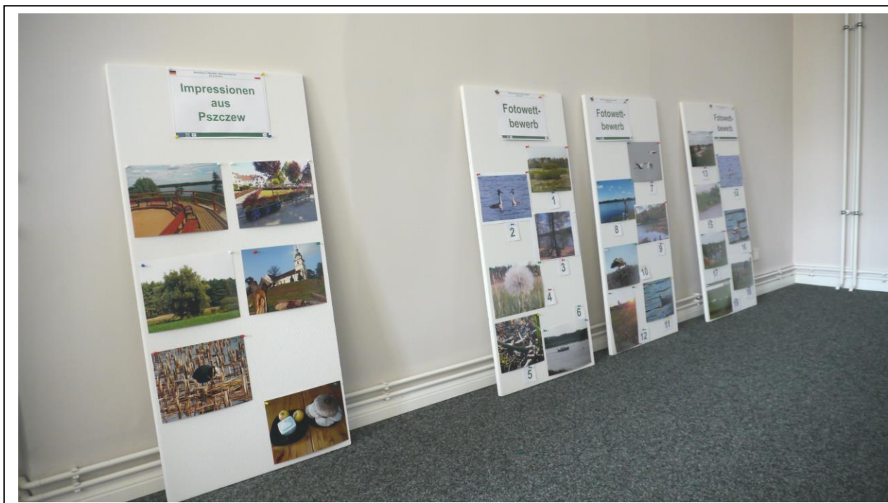
zdjęcie. 7: Zdjęcia złożone do konkursu (tablica po prawej stronie)