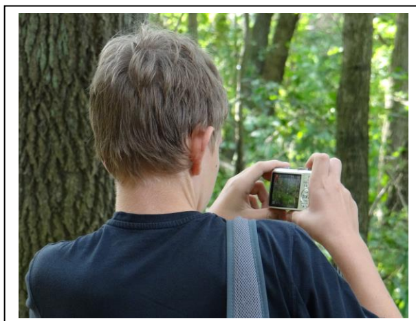
zdjęcie 1 - 6: Polscy i Niemieccy uczniowie fotografują przyrodę. .