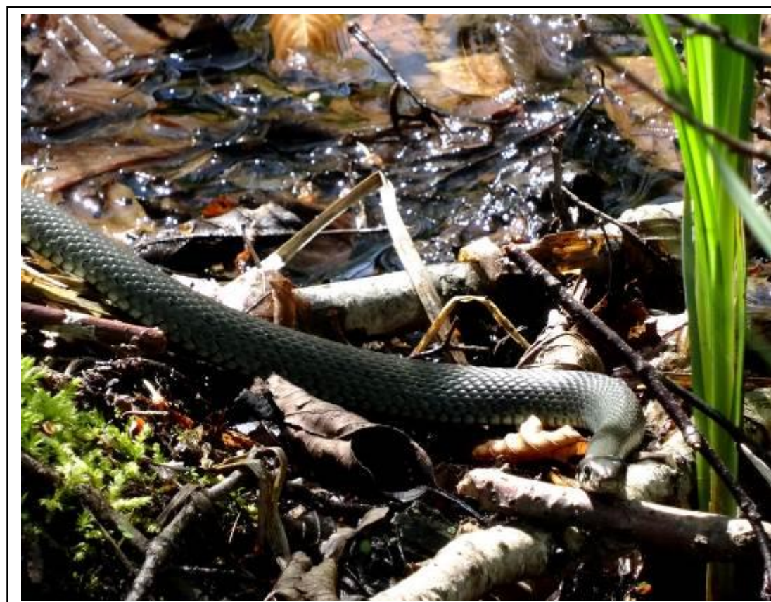
zdjęcie 11 - 12: Zdjęcia konkursowe z Parku Przyrody Barnim (jeziro Liepnitzsee)